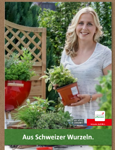
A3-Poster, 1 Ex.