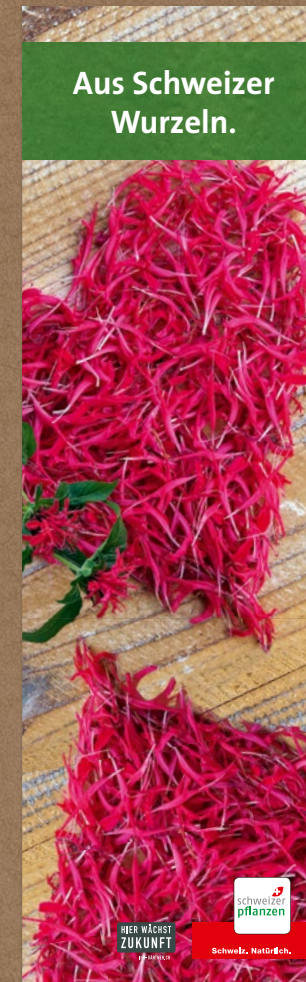
Türbanner, 2 Ex.