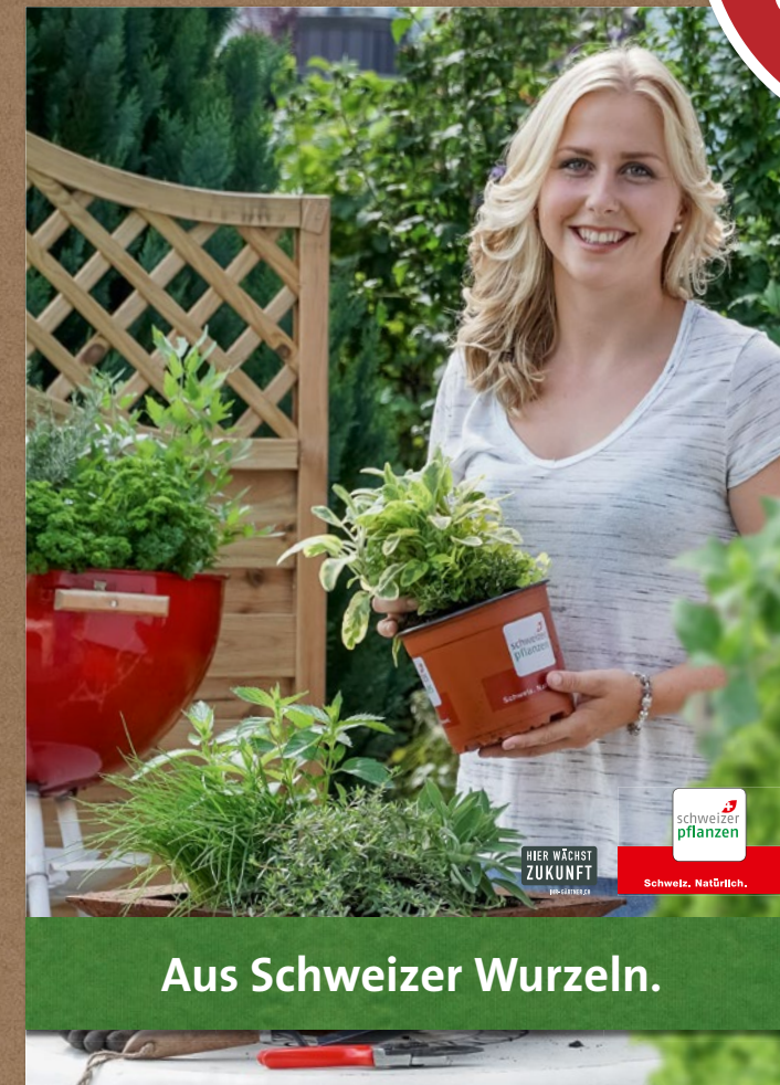
Stopper-Plakat, 2 Ex.