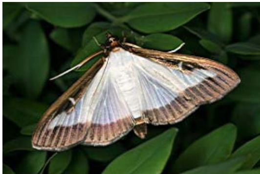
Falter (Grösse: ca. 25 mm)