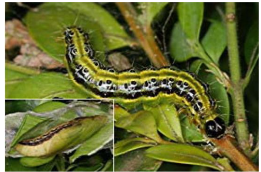
Raupe (Grösse 3 – 50 mm) mit Puppe (kl. Bild)