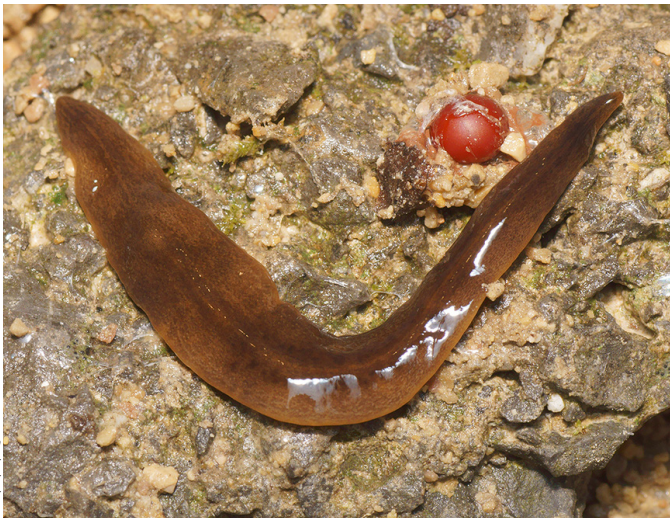
Bildquelle links: Autor Sylvain Petiet, Quelle: https://theconversation.com/obama-nungara-le-vervenu-dargentine-qui-envahit-les-jardins-francais-131004/ .

Bis heute sind in der Schweiz drei problematische gebietsfremde Plattwürmer bekannt: Obama nungara , Diversibipalium multilienatum und Caenoplana variegata (auch genannt: Caenoplana bicolor ). Obama nungara stammt ursprünglich aus Südamerika, D. multilienatum aus Japan und C. variegata aus Australien und Neuseeland.