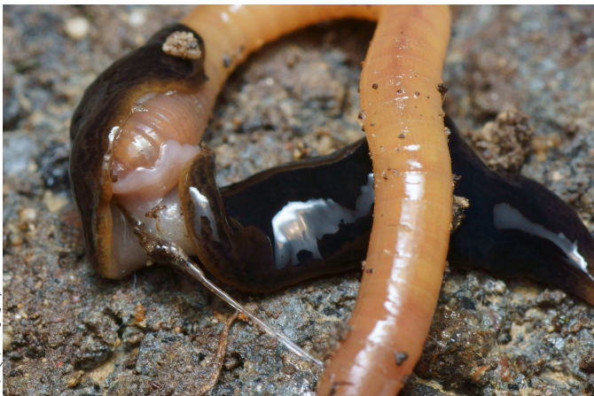
Rechts: Fund im Kanton Tessin.