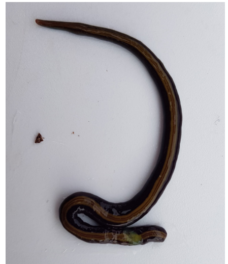
Plattwurm Caenoplana variegata gefunden bei einer Inspektion im Kanton Zürich. Diese Art wird deutlich länger als O. nungara : kann 15–20 cm lang werden.