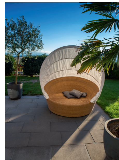
In der Gartenlounge lässt sich die freie Zeit so richtig geniessen.

Wohl die meisten von uns haben schon einmal einen Abend in einer Lounge sanft und gediegen ausklingen lassen. Lässig und entspannt sinkt man in die gepolsterten Sofasessel zurück, geniesst einen Drink und lauscht den Klängen der Musik. So manch einer von uns möchte dieses entspannte Gefühl in seinen eigenen Garten holen. Bietet es doch den besten Sitzkomfort, um sich der Sommerzeit so richtig zu frönen. Moderne Gartenlounges stehen dem Wohnzimmermobiliar in Qualität und Design in nichts mehr nach. Ermöglicht wird dies durch die innovativen Herstellungstechniken und neue, robuste Materialien. Für den gewünschten Komfort auf dem Flechtwerk sorgen wetterbeständige Polster. Die heutigen Kissen und Unterlagen müssen nicht mehr bei jedem Regenschauer