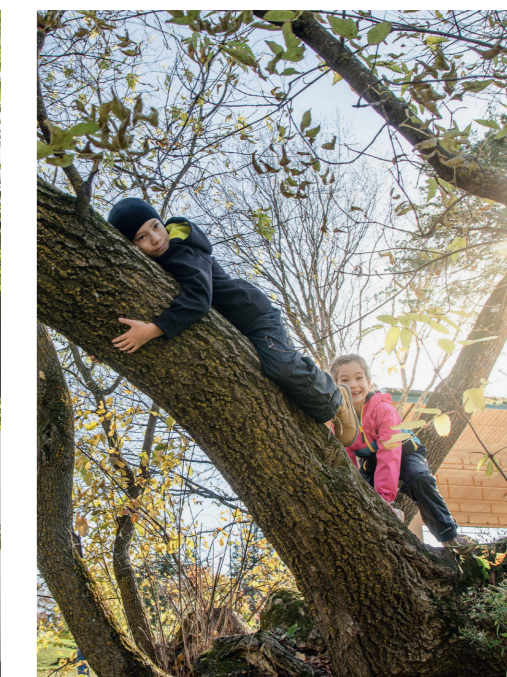
Was gibt es angenehmeres, als sich an heissen Sommertagen im Schatten eines Baumes zu verweilen.