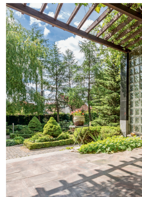
Lauben und Pergolen sind in jedem Garten beliebte raum- und strukturbildende Gestaltungselemente.

Eine eher klassische Variante ist es, das Gerüst mit Wein bewachsen zu lassen. Die Ranken sorgen für mehr Natürlichkeit und helfen, das Bauwerk in das Gesamtbild des Gartens zu integrieren. Bogenkonstruktionen, egal ob sich daran Efeu, Wein, Clematis oder Rosen ranken, eignen sich hervorragend, um eine räumliche Wirkung in den Garten zu bringen. Mit einem Laubengang kann der Blick in die Tiefe des Gartens gelenkt werden oder auch besondere Elemente wie eine Skulptur, ein Brunnen oder ein Formschnittgehölz hervorgehoben werden.