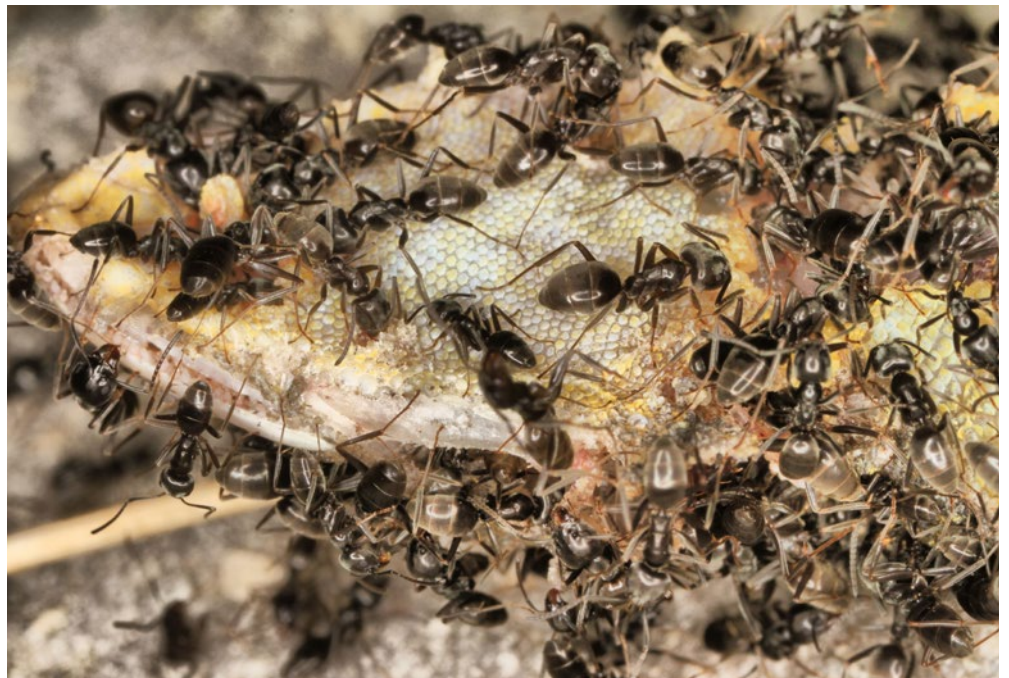
Invasive Ameisen (im Bild Tapinoma Magnum) können bei Bauarbeiten verschleppt werden. Einmal etablierte Bestände sind sehr schwer zu bekämpfen.

Bei beiden Arten fliegen die Königinnen nicht aus, sondern wandern aus der bestehenden Kolonie ab. Dadurch verbreiten sie sich wesentlich langsamer als ihre geflügelten Artgenossen. Der Hauptverschleppungsweg ist mittels Topf- und Gartenpflanzen oder Erdmaterial, das vom Menschen verschoben wird. Daher ist es auch so wichtig, bei Abtransport und Entsorgung von Material aus Befallsgebieten besonders vorsichtig zu sein. Es reicht eine unentdeckte befruchtete Königin um diese Ameisen in ein neues Gebiet zu verschleppen.