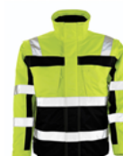
Giubbotto Classe 3