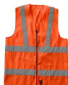
Gilè Classe 2