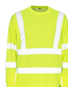
Maglione Classe 3