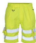
Pantaloni corti Classe 1