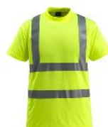
Maglietta Classe 2