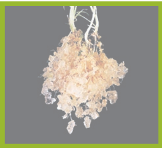
Das Wasserspeichergrenulat lagert sich an Wurzeln ab und versorgt diese dauerhaft mit Feuchtigkeit.

Trockenheit und widrige Bodenverhältnisse machen Bäumen, Sträuchern, Gräsern und Zierpflanzen das Leben schwer. Wenn für die Pflanzen keine Bewässerung installiert werden kann, sollte der Boden in der Lage sein, den letzten Niederschlag über eine möglichst lange Zeit hinweg zu speichern. Dies gelingt mit dem Bodenzuschlagsstoff Stockosorb. Frische Pflanzungen brauchen eine ausreichende Wasserzufuhr, um Ausfälle zu vermeiden. Für ohnehin stark beanspruchte Flächen im Stadtbereich stellt die Trockenheit dar.