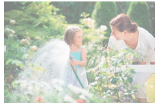
Regenwassernutzung im Garten kann so einfach sein, mit den Pakettösungen von Hug und Zollet AG!

Hug und Zollet AG Adressblock inkl. Logo www.hugzollet.ch