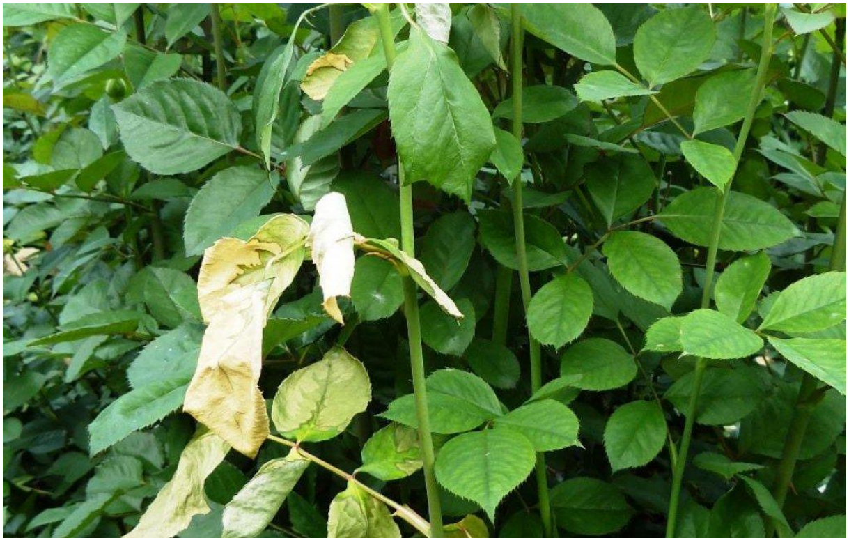
Von Ralstonia solanacearum befallene Rosen

Ein Bakterium mit grossem Schadpotenzial für viele Pflanzenarten!