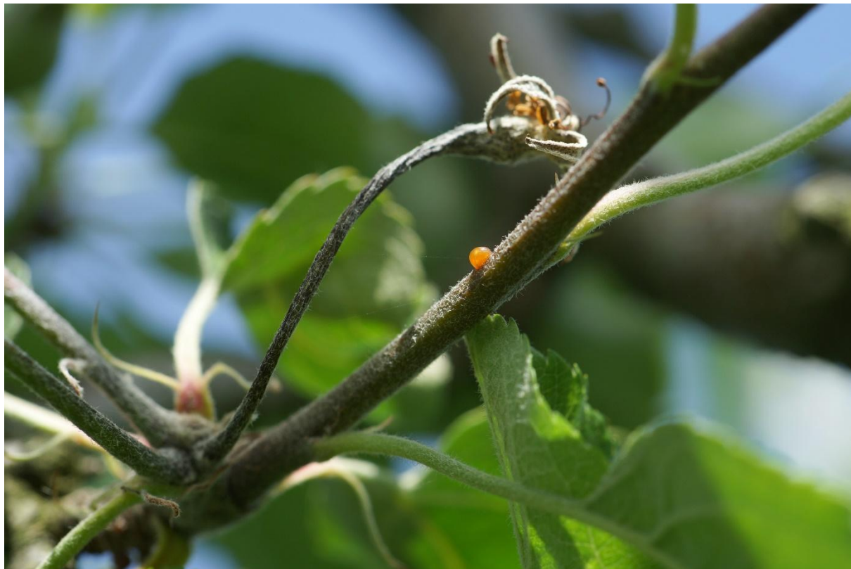
Feuerbrandbefall an Apfelbaum mit sichtbarem Bakterienschleim am Trieb